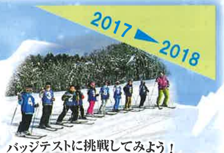
バジテストに挑戦してみよう!