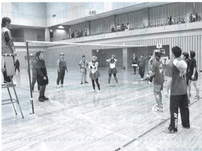
エアバレー GAME in 新庄