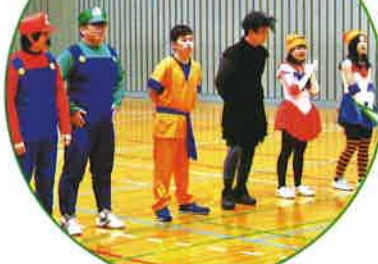
特別仮装賞 ハッスルBチーム