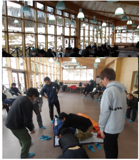
(2) 緊急時対応訓練 毎年、